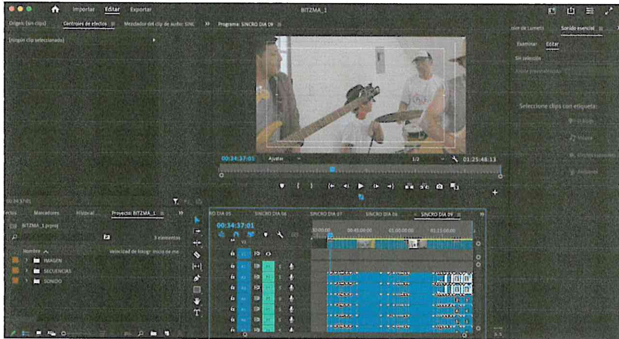
Una captura de pantalla de los proxys

Se realizó la revisión de los materiales durante los días trabajo, se ordenaron las carpetas y se realizaron los proxys de cada día.