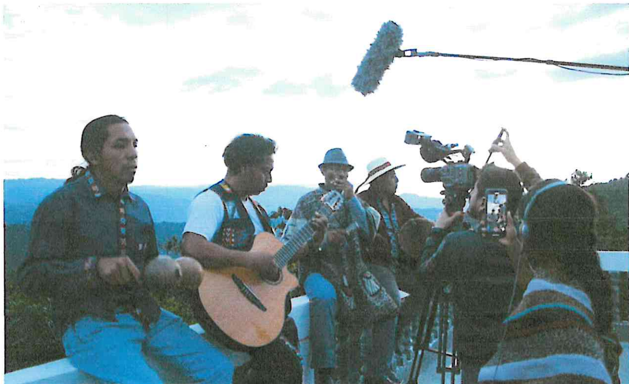
Fuera del estudio de grabación se grabó la convivencia entre los artistas, un a practica motivadora entre ellos, mientras cantaban una de su canciones "el son de don Marcos"