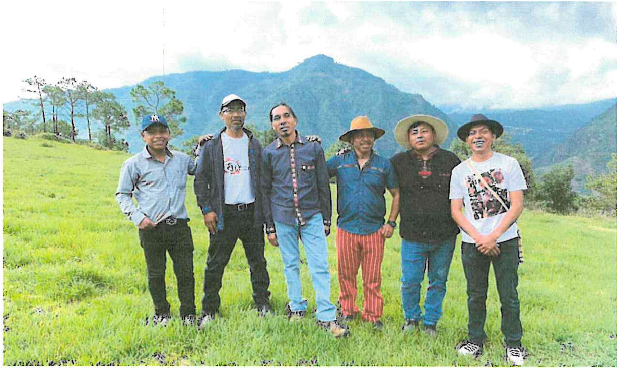
Los miembros de grupo musical