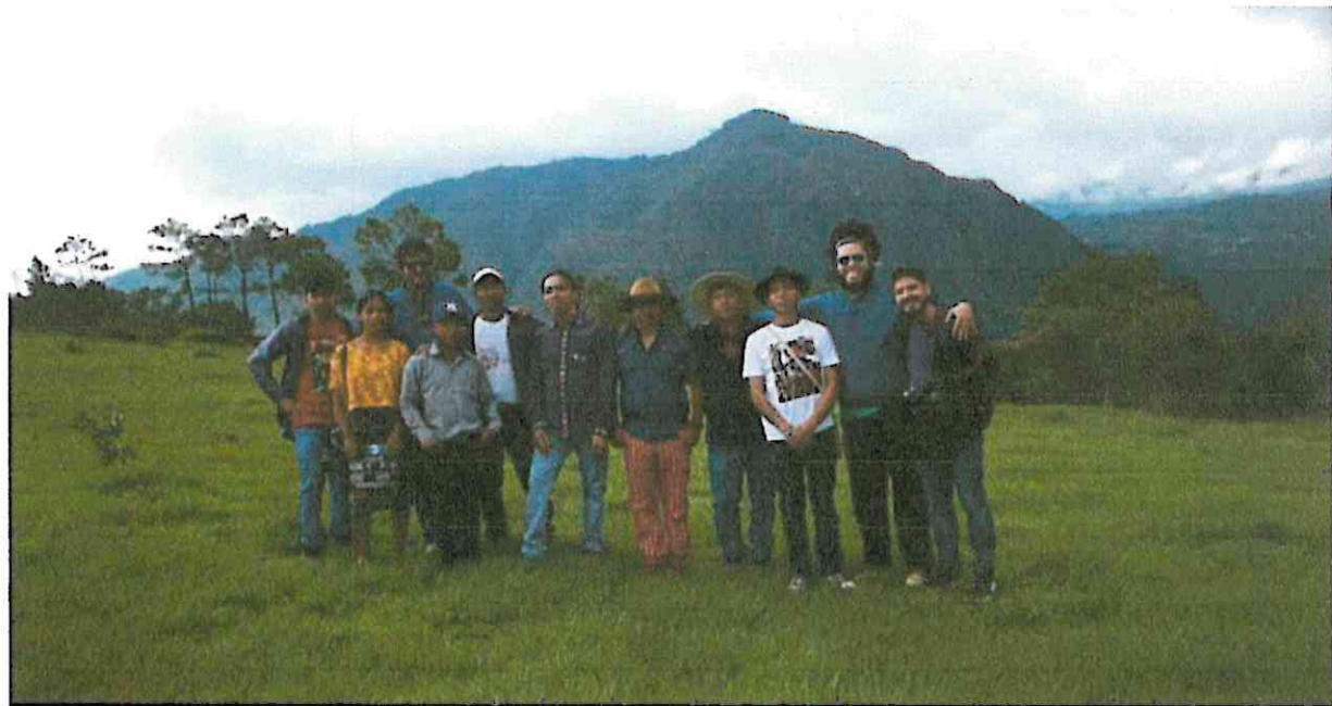
La banda musical y el crew, después de la presentación musical que no se pudo realizar por condiciones del clima