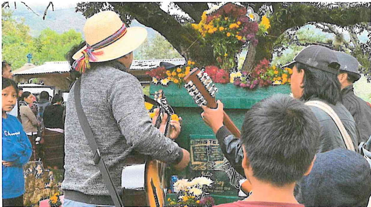
B'itzma en el cementerio de la comunidad La Cumbre de San Ildefonso Ixtahuacán, a través de sus canciones acompañan a las familias en 01 de noviembre (día de los muertos)