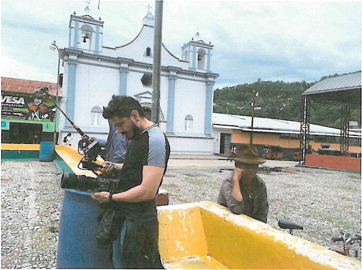
Se grabaron imágenes de relleno, que permite conocer el pueblo de Ixtahuacán y sus habitantes.